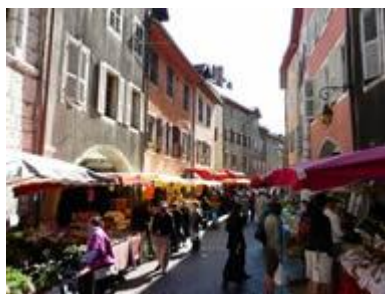
Marché le Vendredi et Dimanche de 08h à 12h dans la Vieille Ville d'Annecy

Et si vous souhaitez simplement vous rendre à Annecy pour profiter de la station, du lac, des paysages, des boutiques, du centre ville historique, du marché du dimanche matin, ou pour encourager les coureurs, vous êtes les bienvenus.