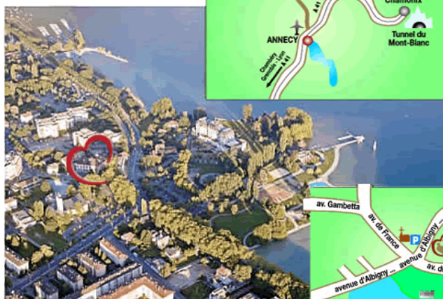
Hôtel près du lac.